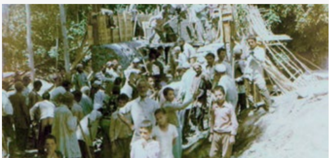
تصویری از احداث پل ارتباطی بین دو طرف روستا

بررسی فعالیت های اولین دوره شورای اسلامی رومدعجن