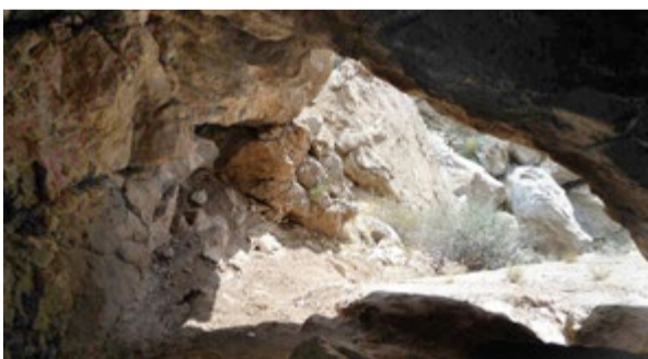
تصویری از دهانه ورودی غار بالای آبشار

دالان اول تونل چندین متری به صورت شیب دار وجود دارد که با پایین رفتن از آن به پرتگاه بسیار خطرناکی مواجه خواهید شد که برای رفتن و دیدن دالان های اصلی باید حتما از پرتگاه عبور کنید، شاید در نگاه اول از تعداد زیاد خفاش ها بترسید اما این خفاش ها آزاری به شما نخواهند رساند.